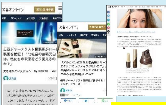
ロート製薬様事例

読者割合は男女比5:5の出版社系ニュースサイトで最も読まれるメディアです!月間6億PVを記録(21年6月)。