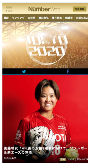
※NumberおよびNumberWebでの特集イメージ

サッカー、バレーボール、バスケットボールなどの人気競技に加え、陸上、水泳、柔道、レスリングなどの伝統競技、スケートボード、ブレイキンといった新しい競技で溢れる今年のパリオリンピック。