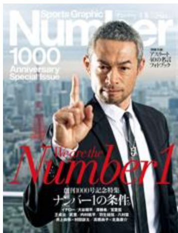
※過去の記念号の表紙