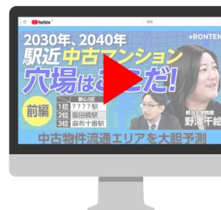
前編:文藝春秋PLUS 公式YouTube