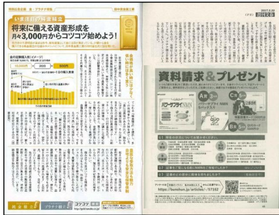
4c1p広告 (純広告orタイアップ)